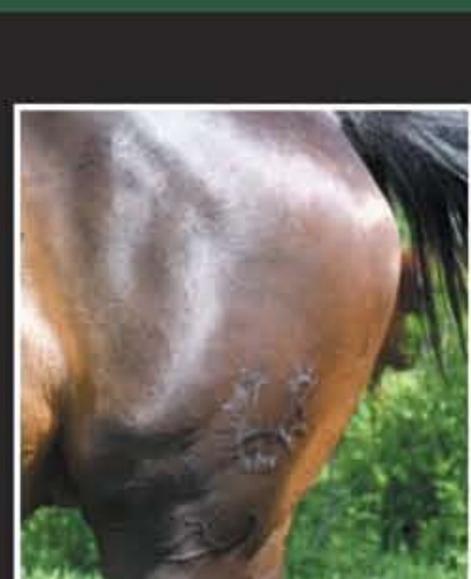
▲ Palenie trakeńskie.

2008 – jako pierwsza księga hodowlana na świecie Związek Hodowców i Przyjaciół Wschodniopruskiego Konia Pochodzenia Trakeńskiego wprowadzi powszechny obowiązek prób dzielności dla klaczy warunkujący uzyskanie Licencji.