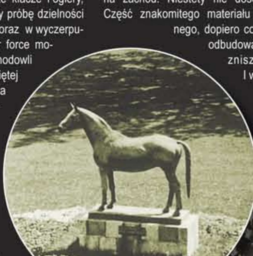
▲▼ Stadnina w Trakenach – budynek główny a przed nim pomnik ogiera Tempelhuber.

być na zawsze utracona. Wiele z tych koni, które opadły z sił, źrebaki odłączone od matek zostało pozostawionych za uciekającym stadłem, wiele zginęło z wycieńczenia, duża część dostała się w sowieckie ręce. W końcu, po okrażeniu przez oddziały sowieckie na (na wpuł zamrażającym) Zalewie Wiślanym większość koni utopiła się bądź zamarzła pod pękającym lodem... Do Niemiec Zachodnich dotarło jedynie 28 koni urodzonych w stadninie w Trakenach