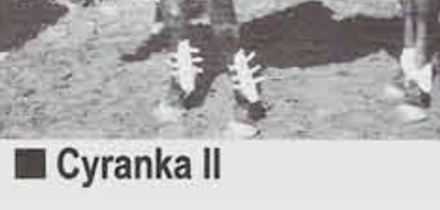
■ Cyrancka II